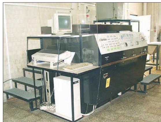
Fot. 5. Stanowisko do badania odporności hydrostatycznej

Badania były wykonane na stanowiskach badawczych, które ilustrują fotografie: maszyna wytrzymałościowa ZWICK – typ 1456 (fot. 4) oraz aparat P59 TE do badania odporności hydrostatycznej (fot. 5).