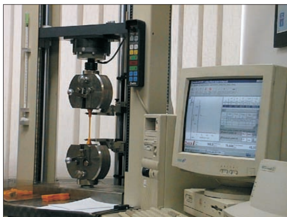
Fot. 4. Stanowisko do oznaczania wydłużenia względnego rur przy zerwaniu

W celu realizacji założonego programu badań przewidziano wykorzystanie aparatury badawczej stanowiącej wyposażenie Laboratorium Tworzyw Sztucznych Instytutu Nafty i Gazu.