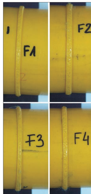
Fot. 3. Próbkę rurowe połączone metodą zgrzewania doczołowego zgrzewarką nr 2